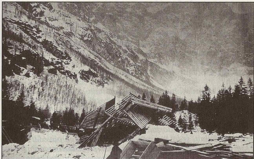
Ruševine doma v Vratih po plazu (1909)