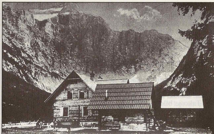
Prvi Aljažev dom v Vratih (1904)